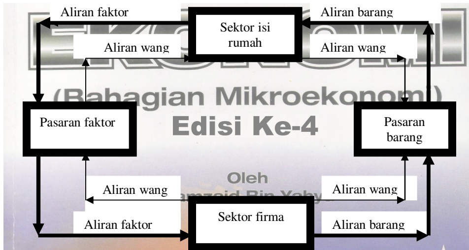
Rajah 1.13: Aliran pusingan pendapatan dalam model dua sektor ekonomi dan di bawah sistem ekonomi pasaran bebas

Gambar rajah 1.13 menunjukkan terdapat dua sektor ekonomi iaitu pertama sektor isi rumah dan kedua sektor firma. Sektor isi rumah adalah merupakan pembekal faktor-faktor pengeluaran – buruh, tanah, modal dan keusahawanan kepada sektor firma, dan faktor-faktor pengeluaran ini akan digunakan oleh sektor firma untuk mengeluarkan barang dan perkhidmatan. Ini bererti bahawa aliran yang mengalir dari sektor isi rumah ke sektor firma ini adalah dalam bentuk fizikal, iaitu seperti jumlah buruh yang digunakan, luas tanah yang disewa, jumlah modal yang digunakan dan tenaga usahawan yang terlibat. Sektor firma pula merupakan pembekal barang dan perkhidmatan yang akan digunakan sebagai barang penggunaan oleh sektor isi rumah. Ini bererti bahawa aliran yang mengalir dari sektor firma ke sektor isi rumah ini juga adalah dalam bentuk fizikal.