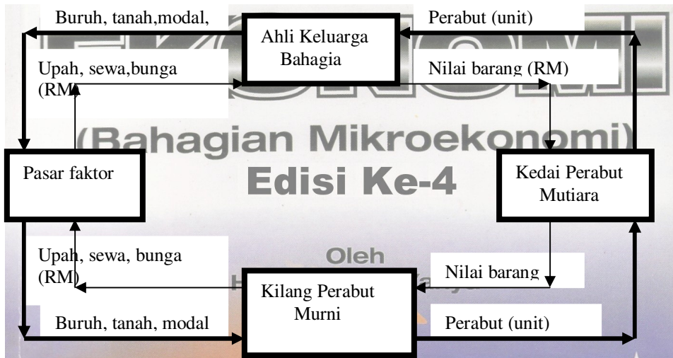
Rajah 1.14: Contoh aliran pusingan pendapatan bagi dua sektor.